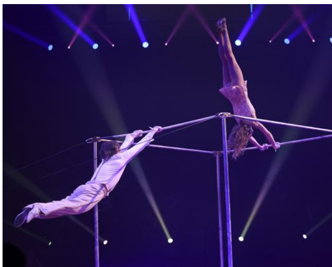
Le poétique duo Rokashkovs.

Notamment le duo Rokashkovs qui, avec autant de poésie que de force, nous a impres-